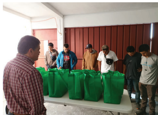
Distribución de alimentos a recolectores de basura