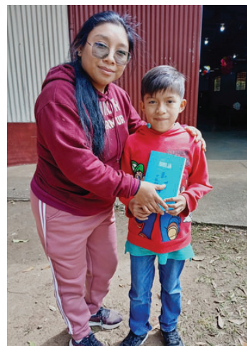
Distribución de Biblias a vecinos y mercados en San Juan Sacatepéquez