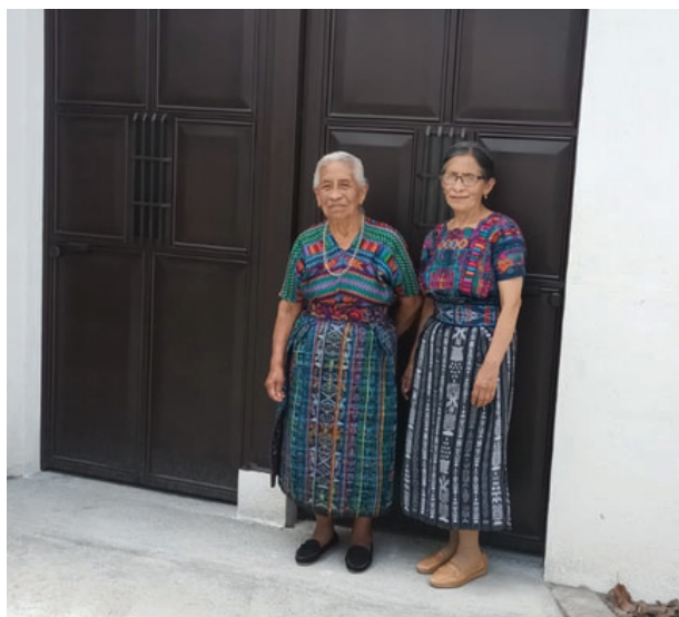
Construcción de casa para pareja de ancianas