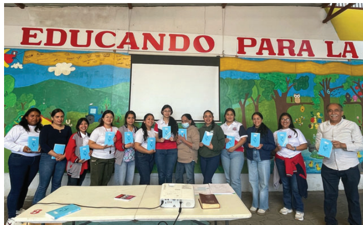
Promoción de AEI en el ministerio Educando para la Vida y en programa "Mujer y Emprendimiento"